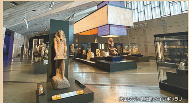
大エジプト博物館・メインギャラリー