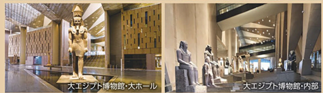
大エジプト博物館・大ホール