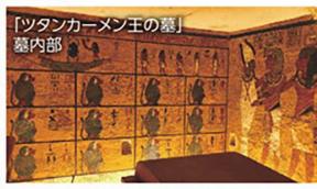
【ツタンカーメン王の墓】 墓内部