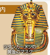
ツタンカーメンの黄金のマスク

2025年11月、待望のオープンを果たした大エジプト博物館。ロイヤル・グランステージの旅では館内での昼食休憩時間も含み約4時間たっぷり滞在。日本語ガイドが見どころを解説します。