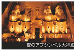
夜のアブシンベル大神殿

◆夜の「音と光のショー」 ◆朝日観賞※ 異なる情景をご覧ください ※朝日は、天候によりご覧いただけ ない場合があります。