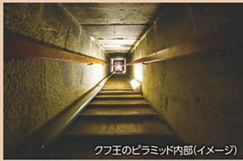
クフ王のピラミッド内部(イメージ)

クフ王のピラミッドは今でも発掘が続き、新たな発見のある神秘の地。日本語ガイドが同行し、通常非公開の地下の間などを見学します。