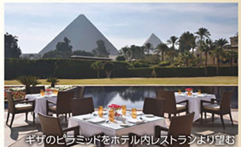
ギザのピラミッドをホテル内レストランより望む

※ピラミッド側のお部屋とは、ピラミッドの一部が客室(ベランダ含む)より見えるお部屋を言います。全景が見えるとは限りません。また、お部屋により景観が若干異なる場合があります。