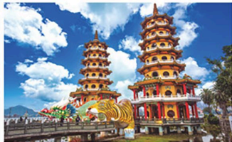
港湾都市・高雄のシンボル、パワースポットとしても知られる蓮池潭の龍虎塔