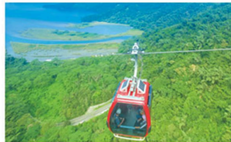
日月潭ではロープウェイに乗り眼下に広がる湖を一望