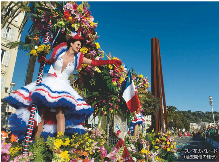
ニース / 花のパレード (過去開催の様子)