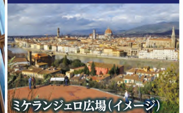
ミケランジェロ広場(イメージ)

ポイント ④ フィレンツェではミケランジェロ広場からの眺めもお楽しみいただけます