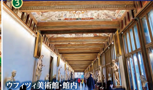
ウフィツィ美術館・館内

ポイント ④ フィレンツェではミケランジェロ広場からの眺めもお楽しみいただけます