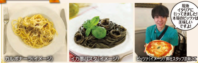
カルボナーラ(イメージ) イカ墨パスタ(イメージ) ピッツァ(イメージ) 弊社スタッフ添乗にて