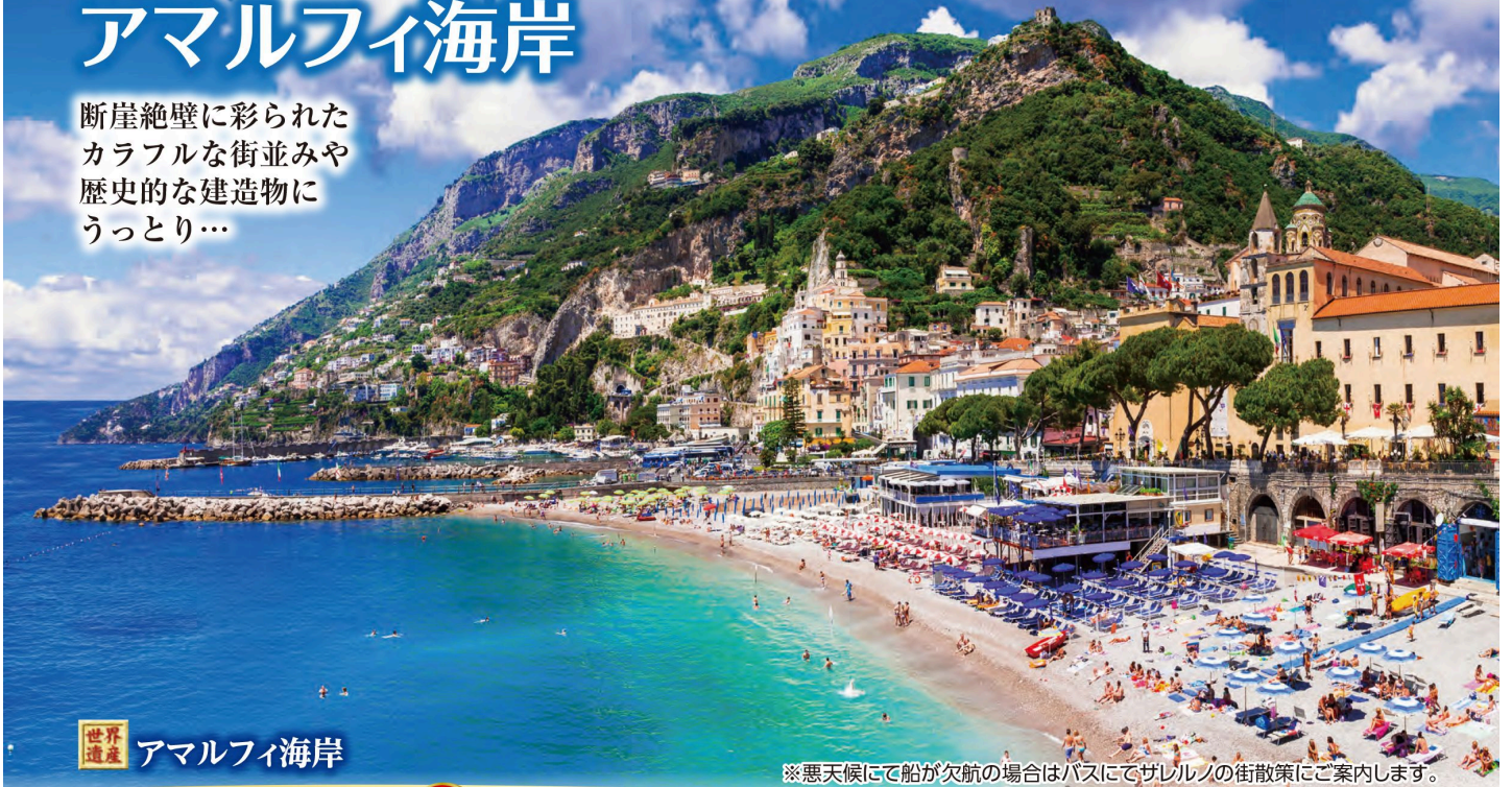
世界遺産 アマルフィ海岸