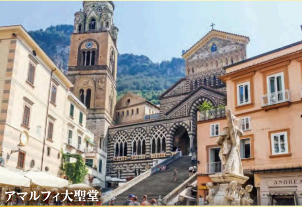
アマルフィ大聖堂

※天候により船が欠航の場合はサレルノの街の散策に変更いたします。 ※フェリーの運航状況によってはアマルフィ海岸滞在中の時間を90分お取りできない場合もございます。