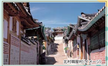
北村韓屋村(イメージ)