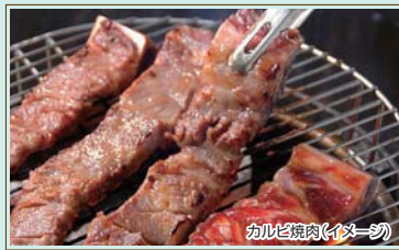
カルビ焼肉(イメージ)