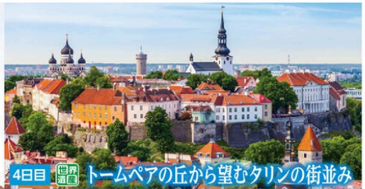
4日目 世界遺産 トームペアの丘から望むタリンの街並み