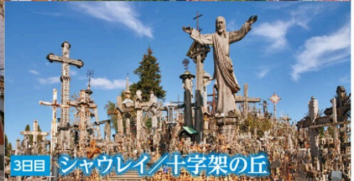
3日目 シャウレイ/十字架の丘