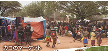
カコのマーケット

ツェマイ族、アリ族、ベンナ族 3つの少数民族が集う素朴で活気ある 雰囲気の魅力のカコのマーケット