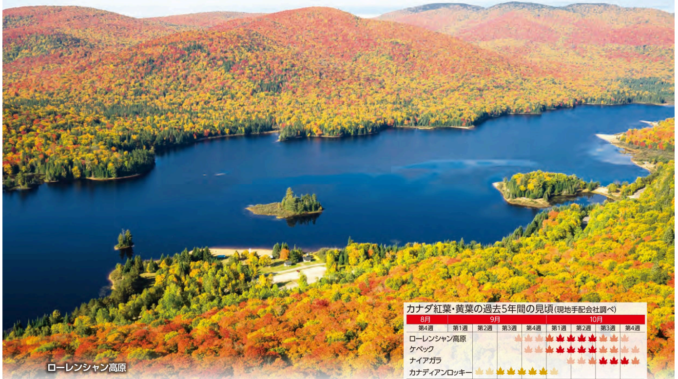
ローレンシャン高原