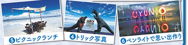
⑤ピクニックランチ