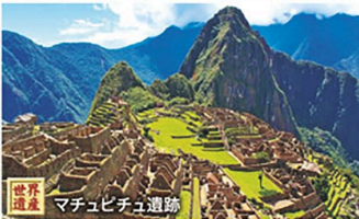
マチュピチュ遺跡