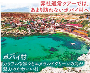
ポバイ村 カラフルな家々とエメラルドグリーンの海が魅力のかわいい村