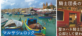
マルサシュロック