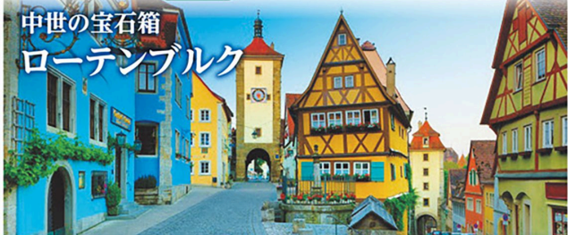
中世の宝石箱 ローテンブルク