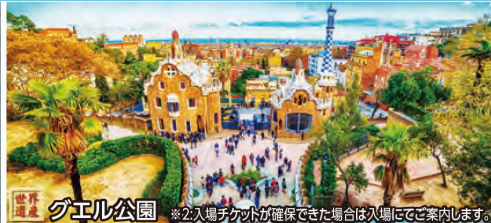
世界遺産 グエル公園 ※2:入場チケットが確保できた場合は入場にご案内します。