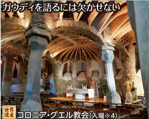
世界遺産 コロニア・グエル教会(入場※4)