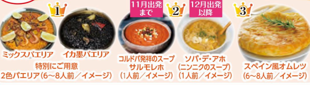
ミックスバリエア | イカ墨バリエア | コルドバ発祥のスープ | ソパ・デアホ | スペイン風オムレツ

2色バリエア(6~8人前/イメージ) | 11月出発まで | 12月出発以降 | 3 |