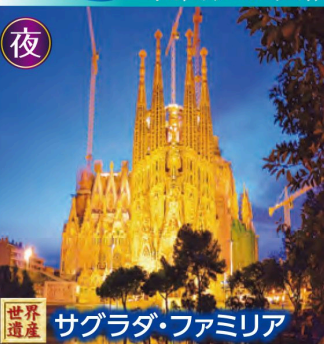
世界遺産 サグラダ・ファミリア

ポイント 3 折角行くならスペインを代表する2大観光地 圧巻の昼・神秘的な夜 2つの姿をご堪能