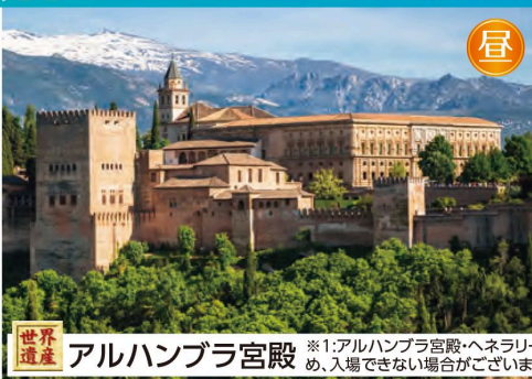
世界遺産 アルハンブラ宮殿