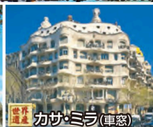
世界遺産 カサ・ミラ(車窓)