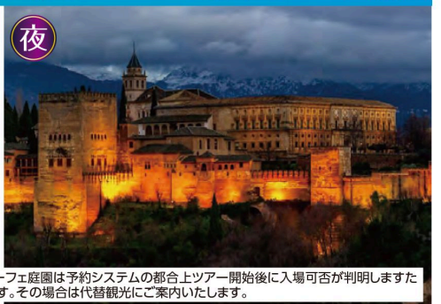
※1:アルハンブラ宮殿・ヘナリーフェ庭園は予約システムの都合上ツアー開始後に入場可否が判明しますため、入場できない場合がございます。その場合は代替観光にご案内いたします。