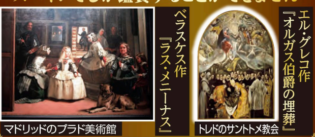
マドリッドのプラド美術館 | エルグレコ作「オルガス伯爵の埋葬」

プラド美術館 2時間滞在 門外不出の大傑作 スペインでしか鑑賞することができません