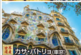
世界遺産 カサ・バトリヨ(車窓)