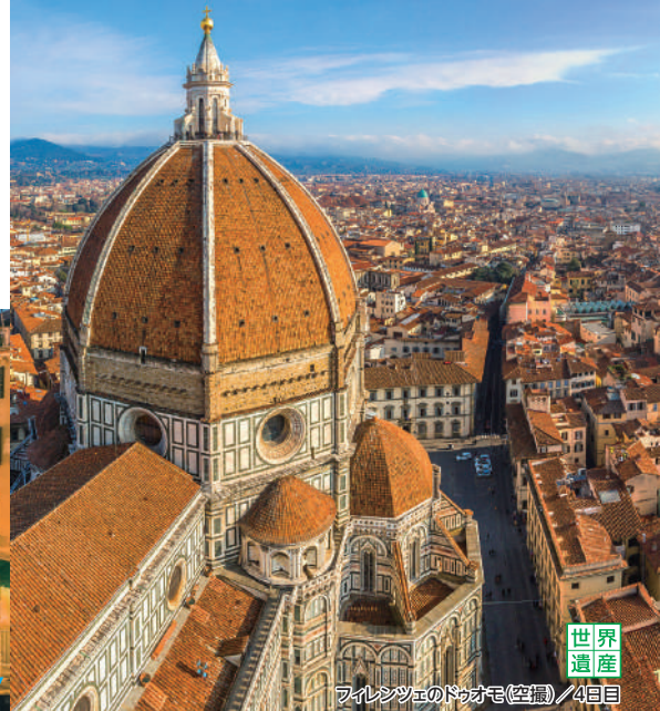
フィレンツェのドゥオモ(空撮)/4日目 世界遺産