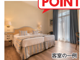
ホテル アマデウス (利用ホテルの一例) 2日目/Aグレード/ベネチア

夕刻や早朝など日帰りの観光客の少ない時間帯のベネチアの雰囲気をお楽しみいただけるのは、本島に宿泊するからこその特権です。