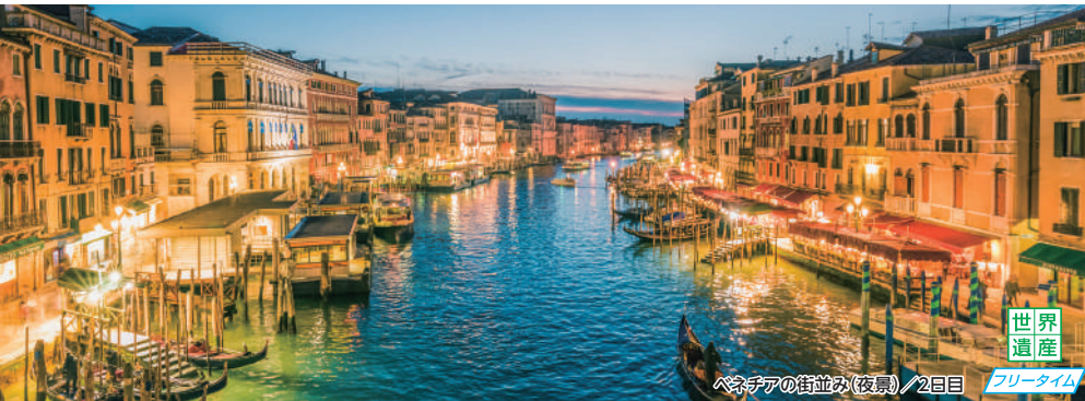
ベネチアの街並み(夜景)/2日目 フリータイム

羽田発着(おとな・子ども同額/エコノミークラス利用/1名様/2名1室利用) ※燃油サーチャージ、空港税等が別途必要となります。