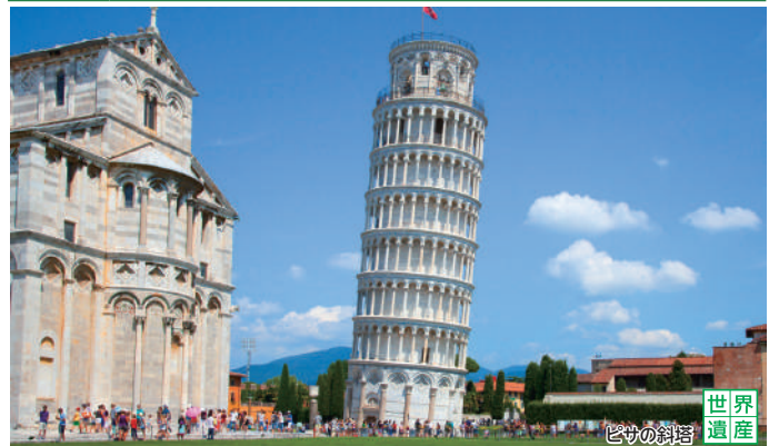
ピサの斜塔の内部の階段を上り、その傾き具合を体感いただけます。