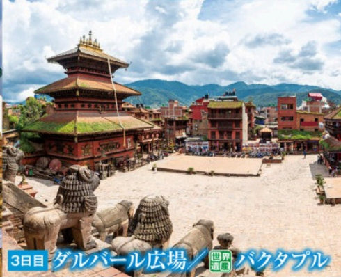
3日目 ダルバール広場 / バクタプル