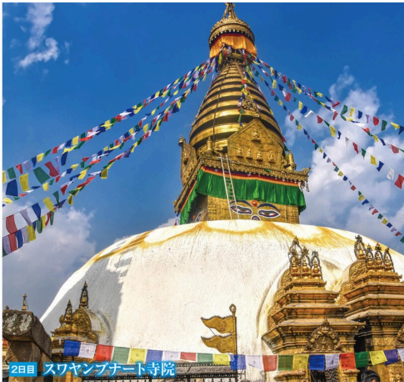
2日目 スワヤンブナート寺院