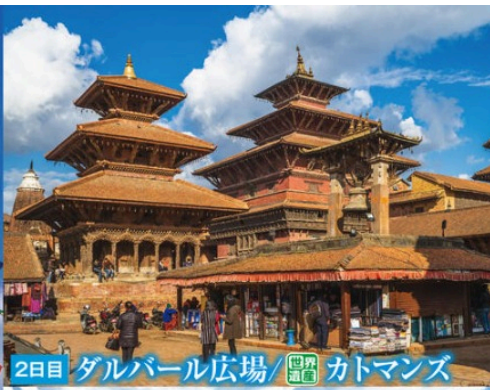
2日目 ダルバール広場 / カトマンズ