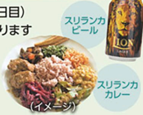
スリランカビール